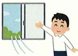
定期的な換気の実施