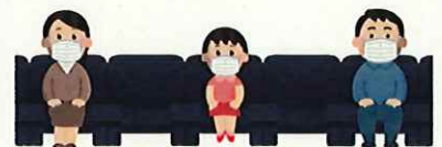
間隔をあけた着席