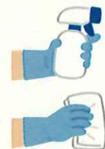
定期的な消毒の実施