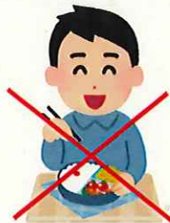
食事やおやつは不可