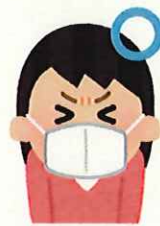
咳エチケットの徹底