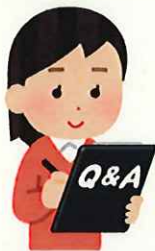
入場者記録表への記入