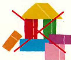
一部の展示装置の休止