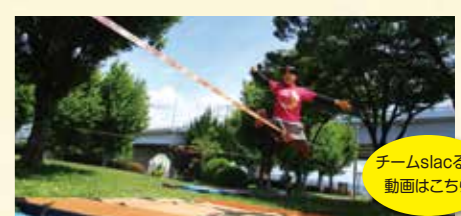
チームslacるの動画はこちら

日没まで練習しています。メンバーは現在17名。交流館のイベントに積極的に参加し、多彩なパフォーマンスで人々を魅了しています。